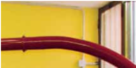
Qui sotto e nella pagina a fianco, torrefazione del caffè all'interno del carcere torinese delle Vallette.